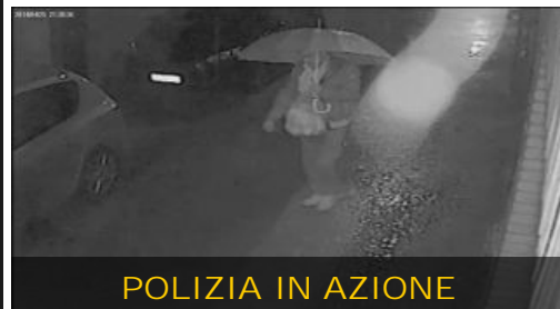
POLIZIA IN AZIONE